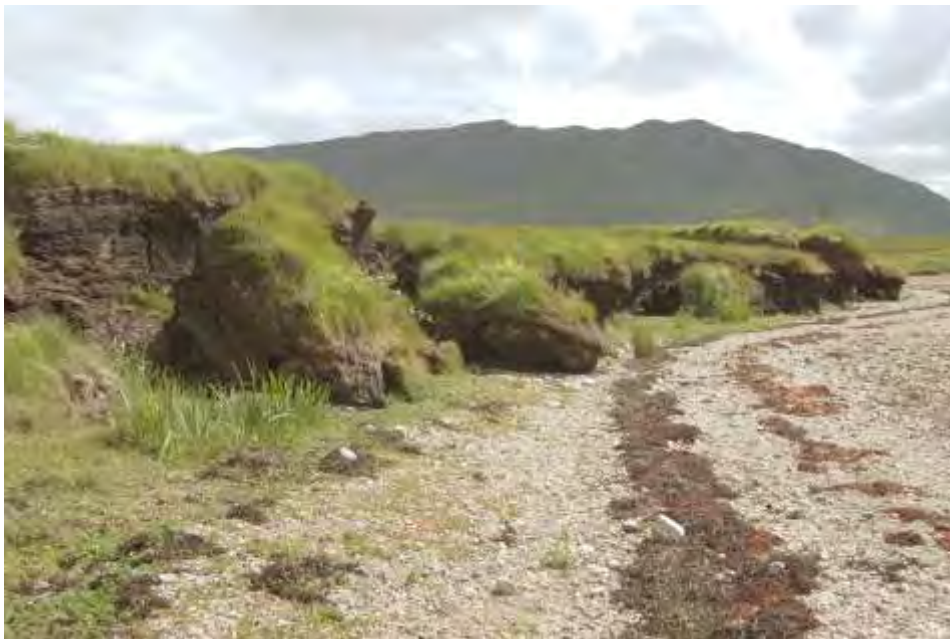
Figure 7 : tourbière développée depuis le Subboréal (défrichement), attaquée par la remontée du niveau marin, ria du sud du Donegal, Irlande.

En Vendée, la tourbe littorale peut s'observer à Brétignolles sur Mer (Bernard et Visset, 2006). En Normandie, ces tourbes ont ré-affleurés début 2014 sur la côte ouest du Cotentin, sur la plage du Fourneau à Granville, à St Jean le Thomas, à la Hauteville, dans le Hâvre de Lingreville, confortant la légende de la Forêt de Scissy, en Baie du Mont St Michel. A Lingreville, la base de la tourbe présente un âge de voisin de 6500 cal BP (Lautridou et Giresse, 1973). C'est aussi le cas du littoral du Bessin à Ver-sur-Mer, avec des troncs en position de vie de la Forêt de Quintefeuille. Ce phénomène est récurrent sur la côte picarde et celle de Flandres maritimes. A Wimereux, la tourbe subboréale a affleuré pour la première fois en 1874, (4700-3600 cal BP; Munaut, 1980). L'affleurement de troncs le plus spectaculaire et le plus ancien (1811) a été observé au Pays de Galles, sur les plages de la baie Cardigan, avec l'émersion de la Forêt de Borth (6000- 4500 cal BP ; fig.7), donnant corps à la légende du royaume de « Cantre'r Gwaelod ». D'autres affleurements, un peu plus récents ont été observés près de Penzance, au pied du St Michael' Mount (Cornwall). Ils sont très fréquents sur la côte ouest de l'Irlande (fig.8).