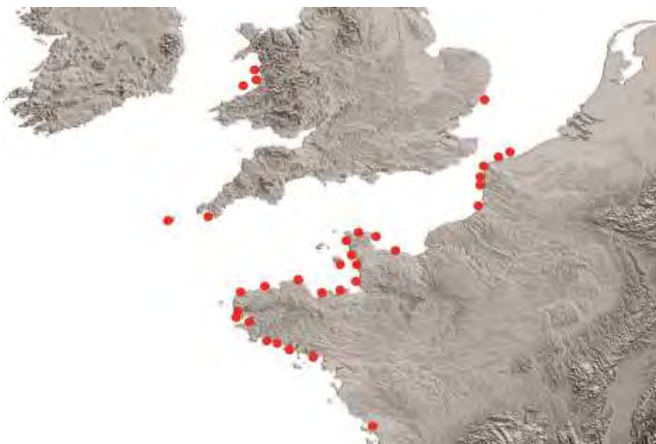
Figure 5 : répartition des affleurements tourbeux récurrents sur la côte ouest européenne (tous âges).

La réputation de ces «tourbes» est d'avoir un âge voisin de 5000 BC (7000 cal BP) et attribué à l'Age du Bronze, une période longue comprise entre 2100 av. J.-C. et 700 av. J.-C. environ en Bretagne, soit 4050-2650 BP. Cette période de 7000 BP correspond en fait au Néolithique (environ -7700 BP ou 5700 BC) et verra la construction des grands monuments mégalithiques, comme le cromlech d'Er Lannic en Morbihan, aujourd'hui ennoyé et, les débuts de l'agriculture, comme à la Pointe de la Torche vers 7600 BP (baie d'Audierne). Pour ce type de date, ce sont des «tourbes» qui affleurent généralement en bas de la zone intertidale actuelle, soit vers -2 à -3 m NGF