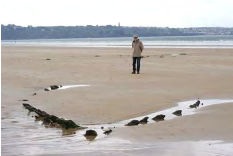
Figure 6 : carcasse de bateau à l'affleurement, Sainte-Anne-la-palud, baie de Douarnenez, avril 2014.

de l'époque romaine (Goslin, 2014), comme aussi celle de Wissant (Pas-de-Calais) ou de St Gabriel (Picardie ; Meurisse-Fort, 2009). La succession de tourbes d'estran à St-Jean-Le-Thomas (baie du Mont St Michel) couvre la période de 5000 à 3000 cal BP (Meurisse-Fort, 2009).