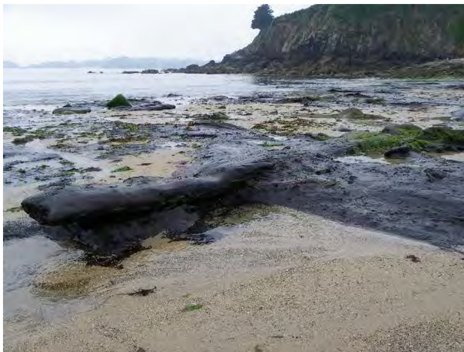
Figure 3: Tourbe et bois, datés à 4670 cal BP Porsmilin, rade de Brest, 2010

devient saumâtre, elle tue les arbres. Les roselières meurent par remontée de la nappe salée et évoluent en schorre herbu. Mais, une tourbière ou un schorre peuvent également subir une oxydation, voire une dessiccation lors de l'incision d'un chenal de marée lors d'une tempête ou de leur mise à l'affleurement par érosion littorale : la « tourbe » devient compacte. Chaque faciès de végétation a sa signature géochimique et isotopique et peut être utilisé comme un marqueur altitudinal vis-à-vis du niveau marin, ce au cours de l'Holocène, nous permettant de reconstruire une courbe eustatique régionale fiable (Goslin et al., 2013 ; Goslin 2014).