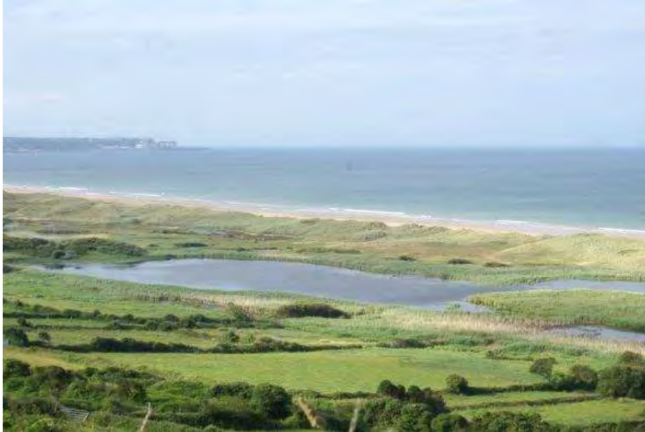
Figure 2 : Dunes de Biville (Ouest Cotentin) avec marais en arrière de cordon dunaire.

région, l'Atlantique Nord, au début de notre interglaciaire, l'Holocène, il y a 11.7000 ans, le niveau marin était situé vers - 60 m sous l'actuel. Beaucoup d'îles étaient rattachées au continent, comme celles de l'Iroise, de Bretagne méridionale ou les îles Anglo-Normandes. Seule, Ouessant est déjà isolée par le Fromveur. Une dernière phase d'accélération, le Meltwater pulse IB s'est terminée vers 6000 cal BP, amenant le long de la façade ouest-européenne le niveau marin vers -6 m en Bretagne (Goslin et al., 2013), avec une vitesse de remontée atteignant environ 6 mm / an. Ensuite, le niveau marin est remonté plus lentement, avec des phases de décélération mais, sans régression métriques ( fig.1). Les seules variations de niveau sont liées surtout à la dilatation ou à la rétraction thermique de l'océan (variations thermostériques) et à la fonte des glaciers « alpins », donnant des variations minimales inférieures au mètre en amplitude.