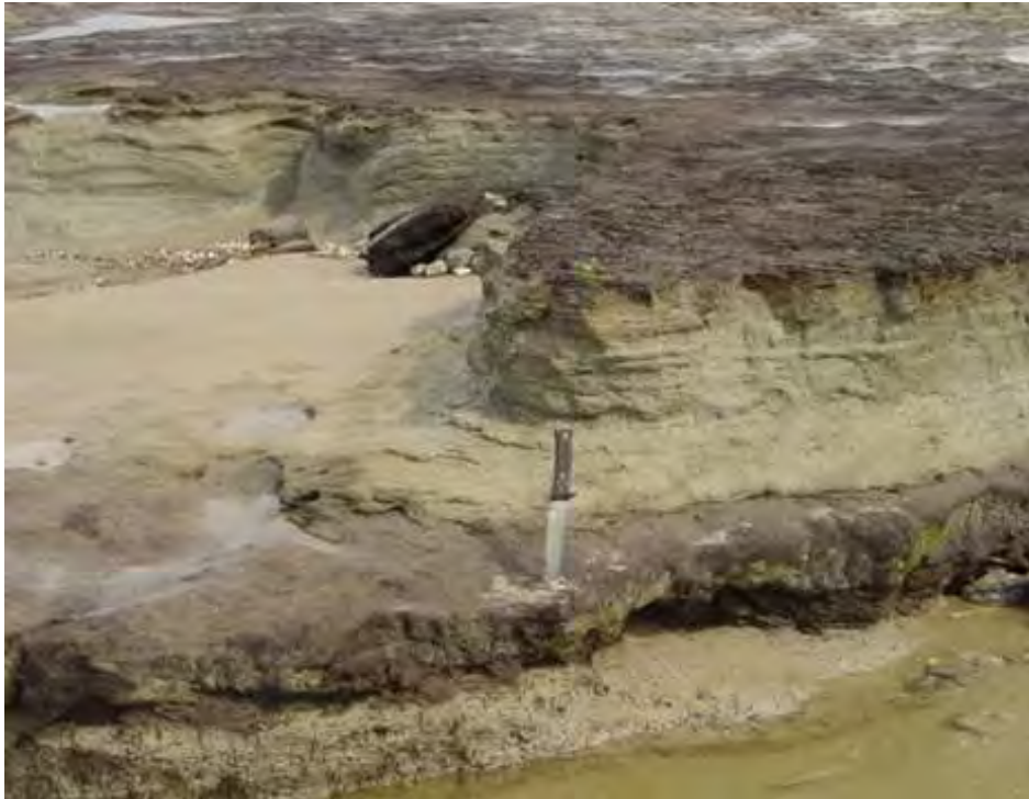
Figure 4 : « tourbes » subboréales de l'estuaire de la Canche (St Gabriel, Picardie) entrecoupées par des incursions de vases tidales (2004). Ces tourbes portent des traces de piétinement par le bétail.

L'acidité des sols en Bretagne, en Cotentin en Cornwall, au Pays de Galles ou encore dans une grande partie de l'Irlande est un facteur de développement des tourbes en zone proche du littoral, cette acidité diminuant l'activité bactérienne dans les marais.