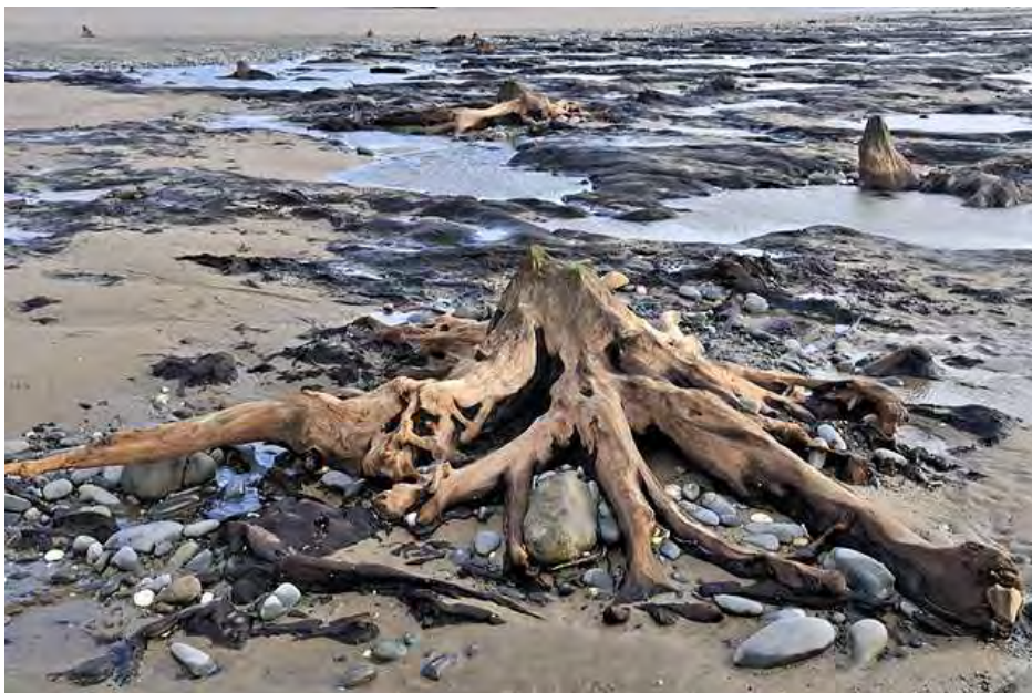
Figure :7 forêt de Borth, baie de Cardigan

Comme nous avons pu le démontrer (Van Vliet-Lanoë et al., 2014a), certains de ces artefacts résultent de terrasses de tempêtes (Mc Kenna et al., 2012) ou des surfaces d’érosion de tempêtes ( Retallack et Roering, 2012 ). De profondes réorganisations des systèmes sédimentaires lagunaires et d’arrière cordon sous l’influence (i) du recul des cordons, (ii) de la tempétuosité mais aussi (iii) de la modifications du lit des cours d’eau côtiers sont aussi invoqués (Goslin et al., 2013 ; Goslin, 2014, Stéphan et al., 2015).